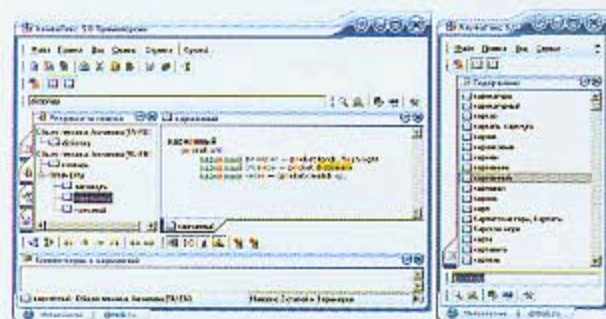
У словаря «АльфаЛекс» два варианта интерфейса — обычный (слева) и компактный (справа)

В программе Translate Now! можно установить до 13 словарей, но в режиме контекстного перевода она предлагает только те, в которых есть данное слово