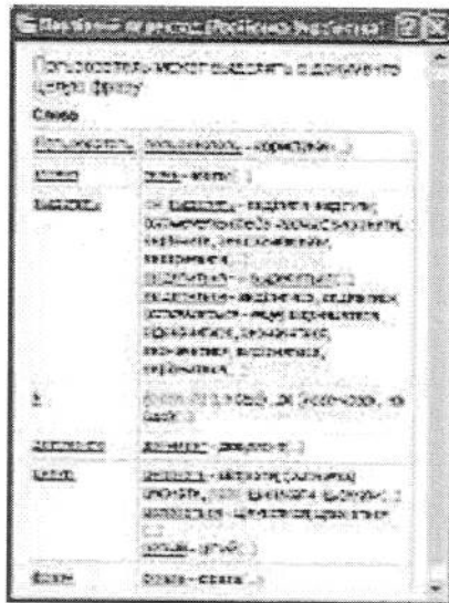
С помощью пословного перевода пользователь может увидеть перевод всей фразы за раз

В целом одиннадцатая версия стоит того, чтобы на нее перейти. Она не предъявляет особых требований к системным ресурсам, но зато освоила украинский язык, и предлагает более широкую функциональность и словарный запас по сравнению с 10-й версией. Тем более что для зарегистрированных пользователей «десятки» апгрейд будет стоить на 20 % дешевле. ☑